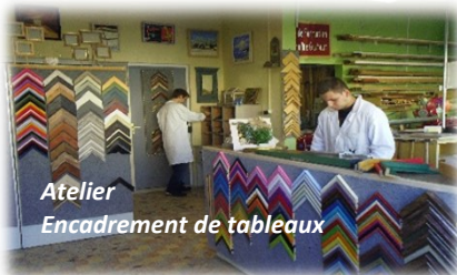
Atelier Encadrement de tableaux

Les jeunes se familiarisent avec le monde professionnel ou se remobilisent dans leur scolarité. Ils abordent la notion de la valeur travail tant au sein des ateliers/ classe et UES que lors de stages de découverte ou d'orientation professionnelle.