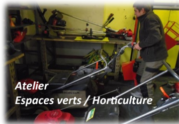
Atelier Espaces verts / Horticulture