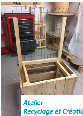
Atelier Recyclage et Création

Durant leur parcours, les jeunes acquièrent un savoir être et un savoir-faire. Ces acquisitions se réalisent par le passage des phases qui balisent la progression tant dans le domaine éducatif et technique que scolaire. Notre accompagnement se fonde sur la reprise de confiance du jeune dans des actions graduelles permettant de mettre l'accent