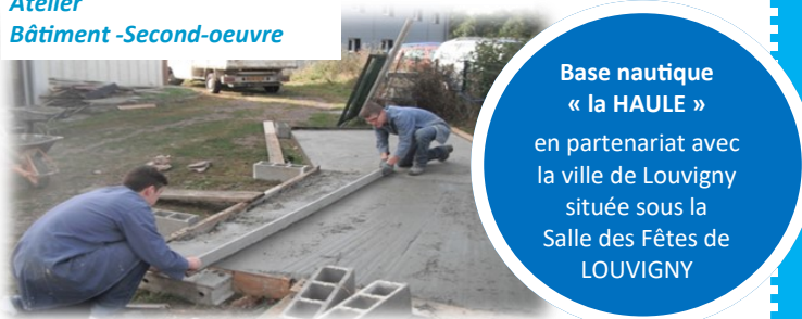
Atelier Bâtiment -Second-oeuvre

Base nautique « la HAULE » en partenariat avec la ville de Louvigny située sous la Salle des Fêtes de LOUVIGNY